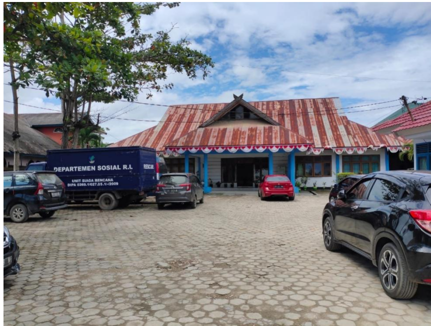
Gerbang utama Dinas Sosial Kota Kendari