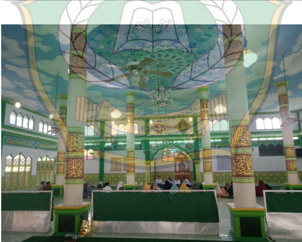
Tampak keadaan suasana di dalam masjid Baitul Izzah Kelurahan Watubangga Kecamatan Baruga