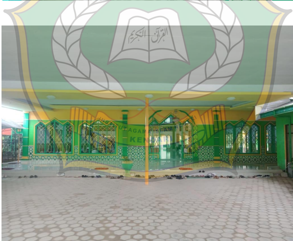
Tampak halaman bagian depan masjid Baitul Izzah Kelurahan Watubangga Kecamatan Baruga