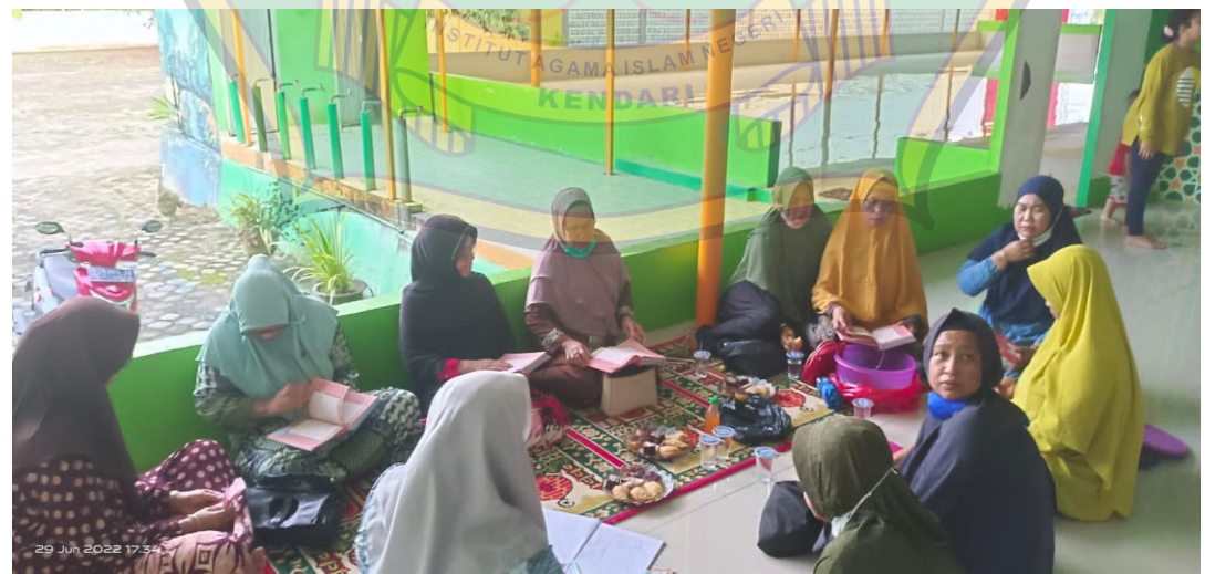
Kegiatan rutin jamaah ibu-ibu majelis ta'lim Baitul Izzah Kelurahan Watubangga Kecamatan Baruga