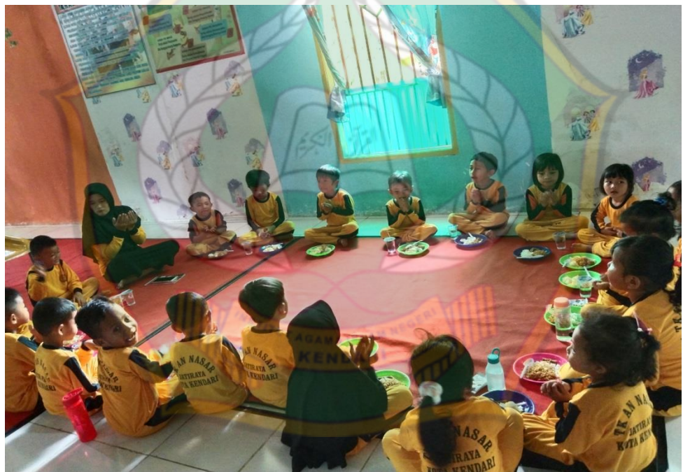
Makan bersama sebelum pulang sekolah