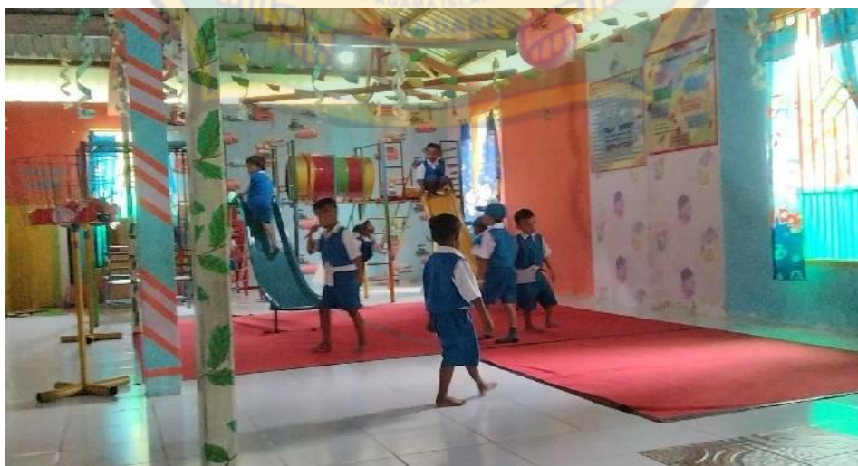
Kegiatan anak saat istirahat setelah selesai pembelajaran