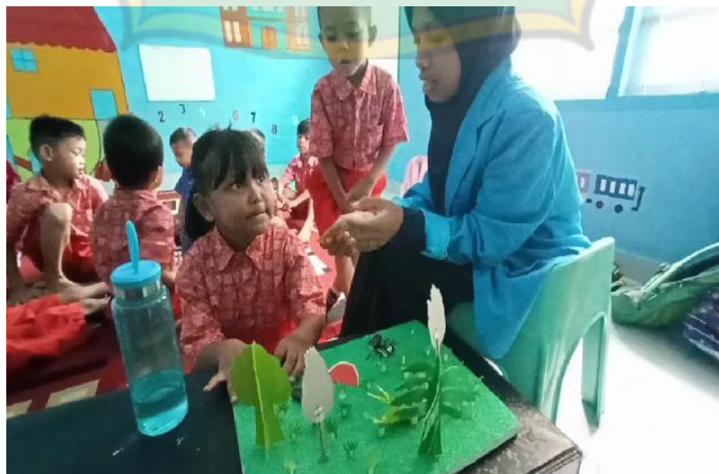
Kegiatan tanya jawab antara peserta didik dan peneliti setelah bercerita