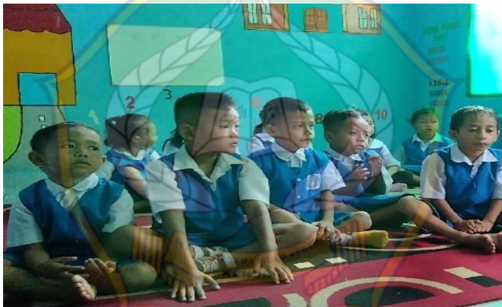
Anak melakukan materi pembiasaan dengan bershalawat dan menghafal doa-doa pendek