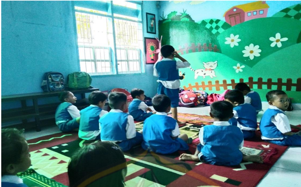
Anak sedang adzan sebelum melakukan kegiatan sholat dhuhah