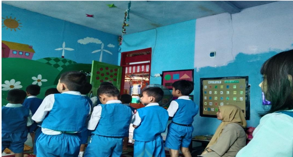
Rutinitas setiap pagi sholat dhuhah sebelum memulai pelajaran di kelas