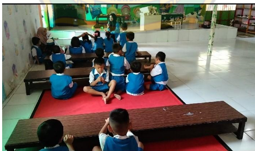
Kegiatan anak saat proses belajar mengajar di TK An' Nasar