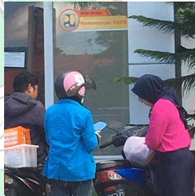
Proses Pengantaran dan Transaksi