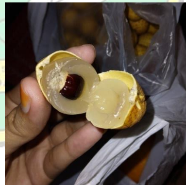
Penampakan Buah-buah yang di Jual