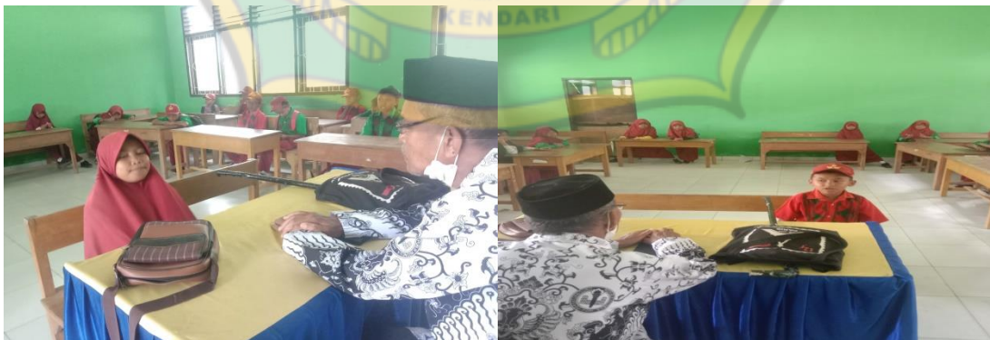
Siswa-Siswi Kelas IV hafalan surah-surah pendek sebelum pulang