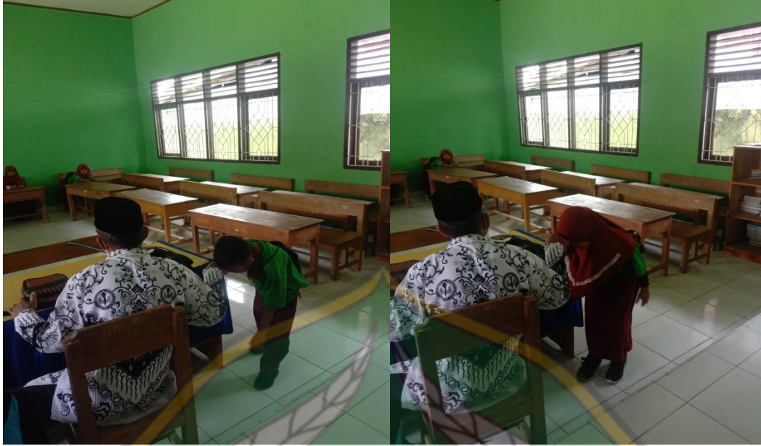
Siswa-Siswi Kelas IV Mencium tangan Guru Sebelum Pulang sekolah