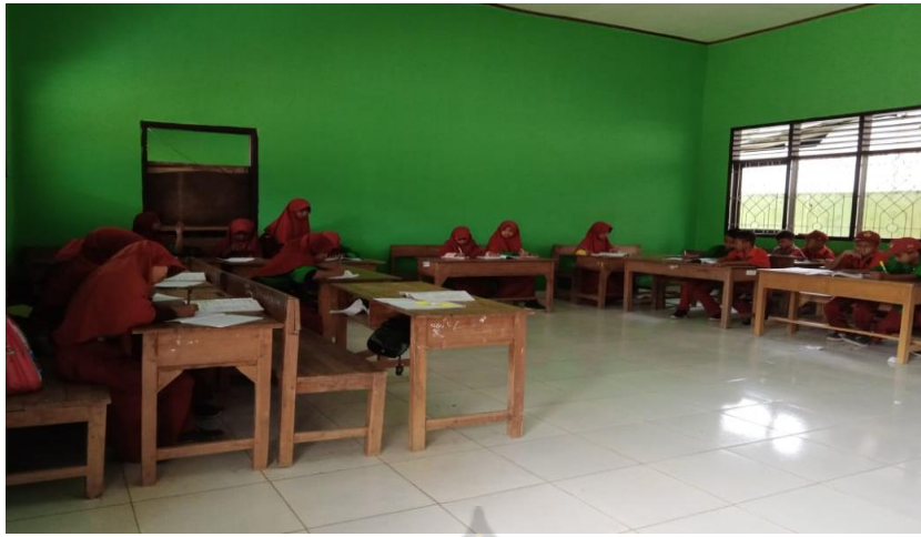
Proses Pembelajaran PAI di Kelas IV