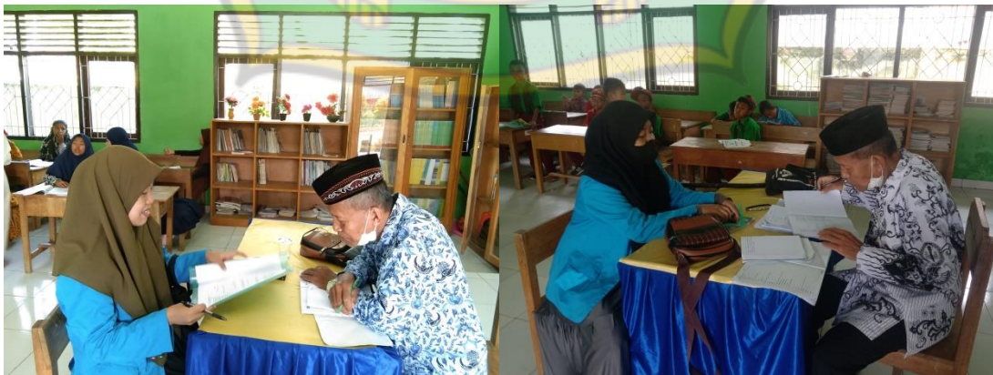
Wawancara dengan Guru Pendidikan Agama Islam kelas IV SD Negeri 62 Kendari