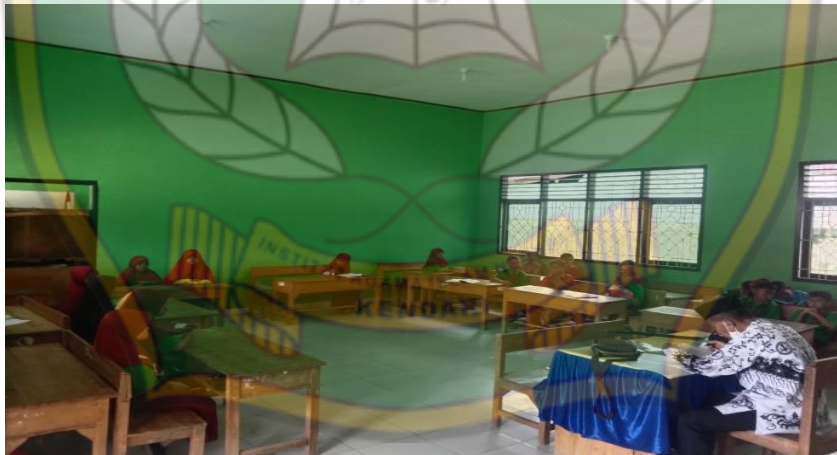
Proses Pembelajaran PAI di Kelas IV