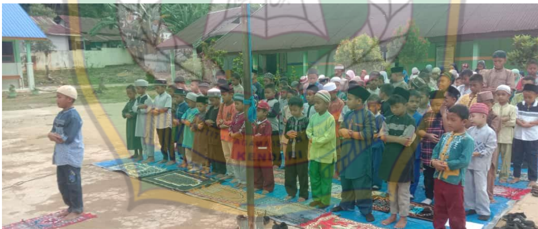
Kegiatan Sholat Dhuha berjamaah Jum'at pagi di SD Negeri 62 Kendari