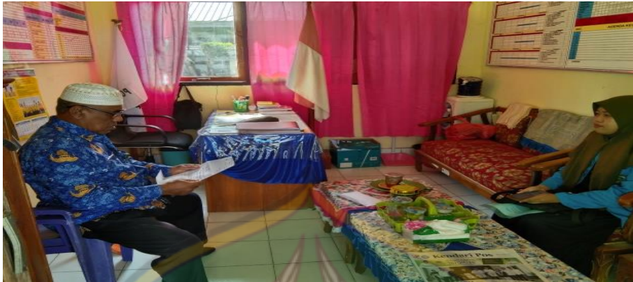
Penyerahan surat Izin Penelitian kepada Kepala SD Negeri 62 Kendari