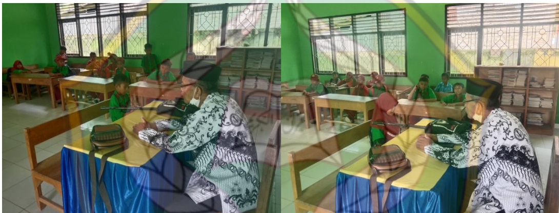
Siswa-Siswi Kelas IV hafalan surah-surah pendek sebelum pulang