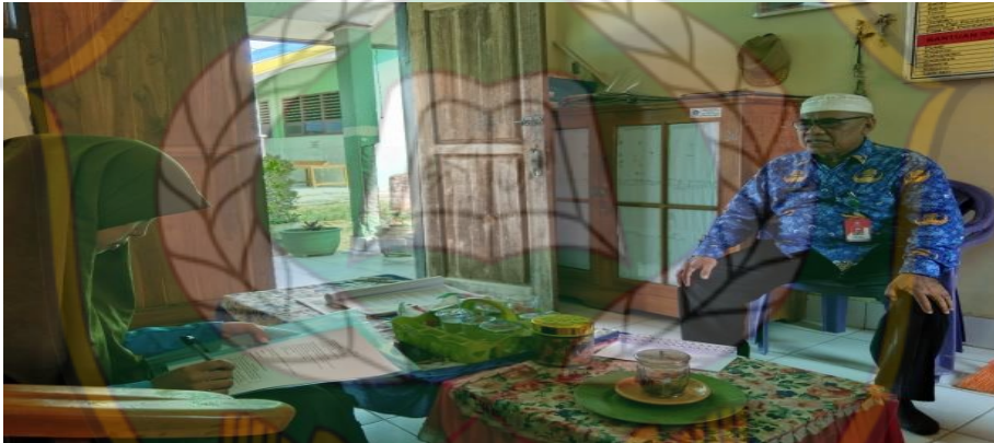
Wawancara dengan Kepala SD Negeri 62 Kendari