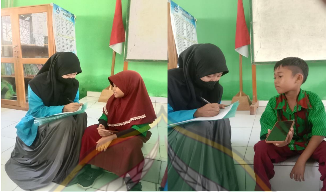
Wawancara dengan Siswa-Siwi Kelas IV SD Negeri 62 Kendari